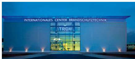
INTERNATIONALES CENTER RANDSCHUTZTECHNIK RAND- UND RAUCHSCHUTZ