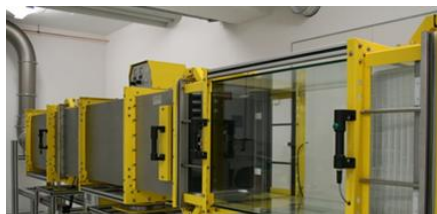
ÜR HÖCHSTE ANSPRÜCHE LTERTECHNIK