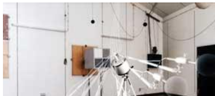
URCHFÜHRUNG VON CHALLMESSUNGEN KUSTIK